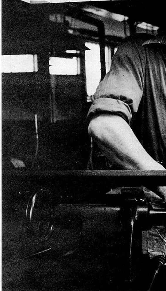
Ici, la machine facilite le travail en le rendant plus rapide et moins fastidieux mais le coup de main garde toute son importance à certains